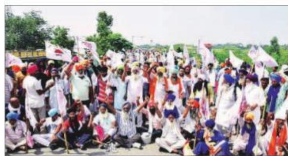
Ten farmer organisations from Karnataka, Kerala, Madhya Pradesh, Maharashtra, Odisha, Telangana, Tamil Nadu and Uttar Pradesh participated in discussions with the Supreme Court-appointed committee members

Ten farmer organisations from Karnataka, Kerala, Madhya