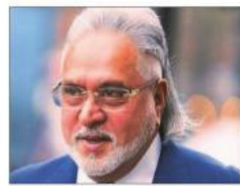
The SC had in June directed its registry to explain as to why Mallya's review petition had not been listed for the last three years

While the apex court had directed Mallya twice — in April and October 2016 — to disclose all assets held by him and his family, Mallya had then claimed that banks had already recovered ₹2,494 crore from defunct Kingfisher Airlines